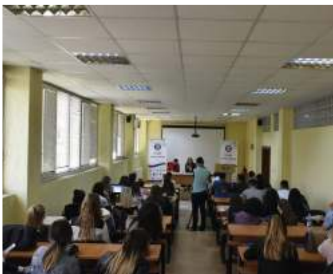
Kosova ka mungesë të noterëve

Themelimi i noterisë në Kosovë, u ka ndihmuar qytetarëve të Kosovës për zgjidhjen e problemeve që kanë të bëjnë me çështjet ligjore, ndërkaq në të njëjtën kohë është lehtësuar puna e gjykatave në vend.