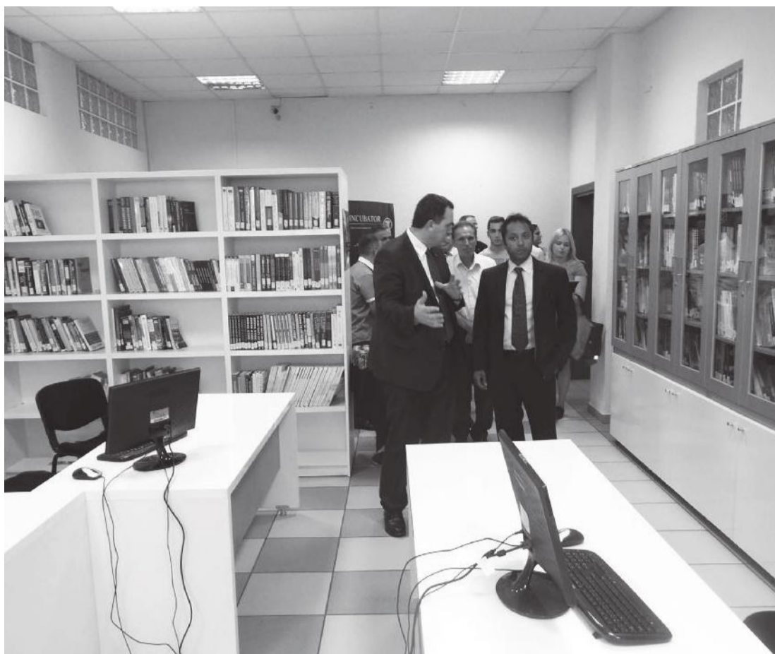
UBT I GATSHËM EDHE PËR NJË HAP TË RËNDËSISHËM