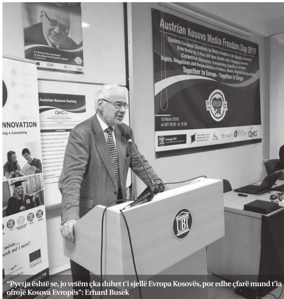
"Pyetja është se, jo vetëm çka duhet t'i sjellë Evropa Kosovës, por edhe çfarë mund t'ia ofrojë Kosova Evropës": Erhard Busek

NGA KONFERENCA "DITA AUSTRIAKE-KOSOVARE E INTEGRIMEVE EVROPIANE"