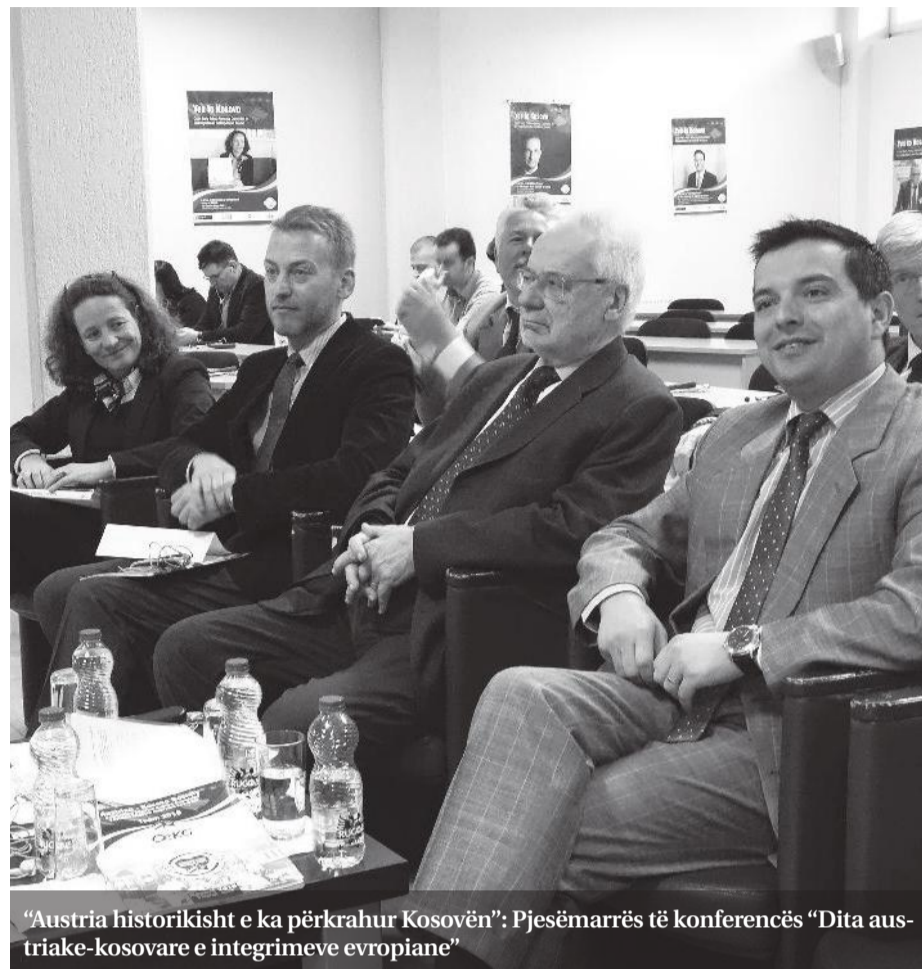
"Austria historikisht e ka përkrahur Kosovën": Pjesëmarrës të konferencës "Dita austriake-kosovare e integritimeve evropiane"