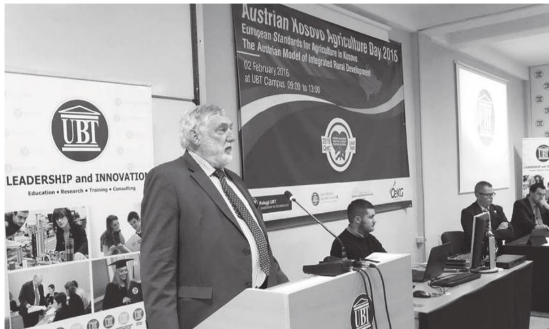
Kosova pranohet në Organizatën Botërore të Ushqimit

“Meqenëse ushqimi është prodhimi kryesor i njeriut, dhe duke u bazuar në të dhënën që prodhimet ushqimore në tërë rruzullin tokësor përfundojnë në muajin shtator, UBT, në fokus të vetin të studimeve do ta ketë këtë fushë, gjithnjë duke pasur për bazë gjetjen e alterna-