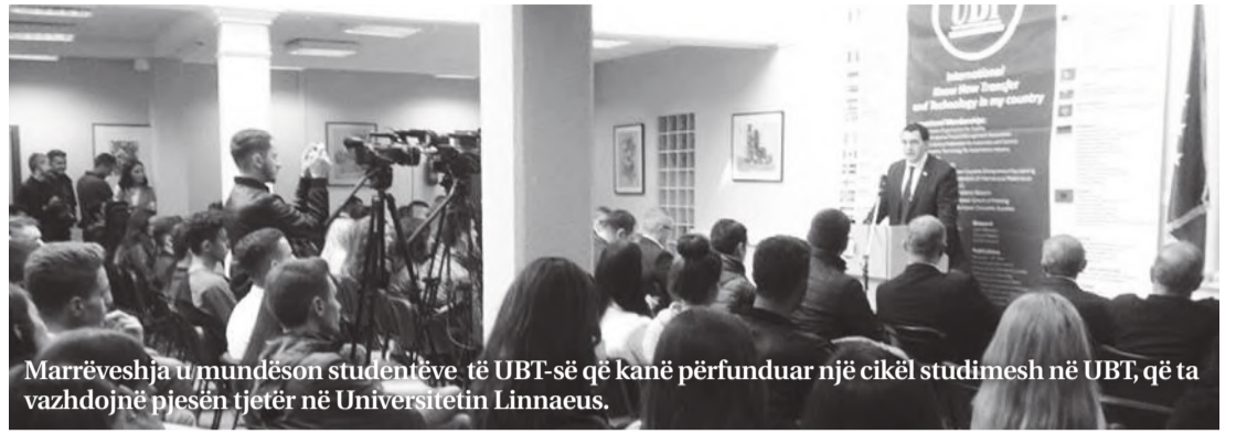
Marrëveshja u mundëson studentëve të UBT-së që kanë përfunduar një cikël studimesh në UBT, që ta vazhdojnë pjesën tjetër në Universitetin Linnaeus.

Po ashtu, marrëveshja u mundëson studentëve të UBT-së që kanë përfunduar një cikël studimesh në UBT, që ta vazhdojnë pjesën tjetër në Universitetin Linnaeus. Me marrëveshjen e sipërhënuar, UBT-së i mundësohet edhe ofrimi i studimeve të doktoratës në bashkëpunim me profesorë nga Universiteti Linnaeus. Studentët e interesuar të UBT-së, më shumë informata rreth aplikimeve mund të marrin në Zyrën për Marrëdhënie Ndërkombëtare të UBT-së, numër 304, katë 3.