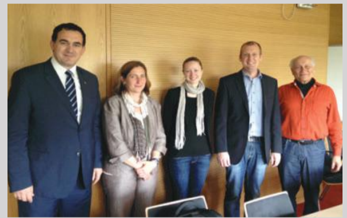
Tema kryesore e bisedave ishte transferi i dijes nga universiteti në shoqëri

Universiteti RWTH Aachen është pjesë e “Iniciativës për ekselencë” dhe renditet si një ndër universitetet më të mira në Republikën Federale të Gjermanisë.