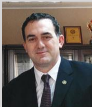
u bisedua për mundësinë e bashkëpunimit në fusha të ndryshme

Gjatë kësaj vizite, rektori i UBT-së pati takime të shumta me ekspertë, kompani, universitete, institucione akademike dhe qeveritare, gjatë të cilave