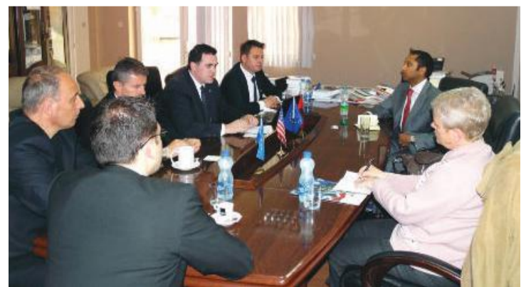
Si pjesë e partneritetit afatgjatë, Ambasada e SHBA-së dhe UBT u përkushtuan të punojnë në gjetjen e mënyrave për avancimin e zhvillimit profesional, përmirësimin të ambientit biznesor dhe mbështetjen institucionale për vetëpunësim dhe ide kreative biznesore të studentëve

Si pjesë e partneritetit afatgjatë, Ambasada e SHBA-së dhe UBT u përkushtuan të punojnë në gjetjen e mënyrave për avancimin e zhvillimit profesional, përmirësimin të ambientit biznesor dhe mbështetjen institucionale për vetëpunësim dhe ide kreative biznesore të studentëve.