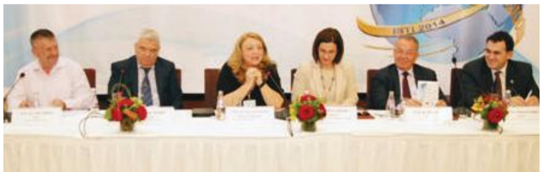
Konferenca dyditore shkencore në nivel ndërkombëtar me temën "Sistemet e Informacionit dhe Teknologjitë inovative drejt një ekonomie digjitale"

12 qershor 2014- Departamenti Matematikë, Statistikë dhe Informatikë në kuadër të Fakultetit të Ekonomisë në Universitetin e Tiranës (UT), për herë të pestë organizoi konferencën dyditore shkencore në nivel ndërkombëtar me temën "Sistemet e Informacionit dhe Teknologjitë inovative drejt një ekonomie digjitale". Konferenca u organizua nën patronazhin e Akademisë të Shkencave të Shqipërisë, dhe me bashkorganizim të UBT-së, dhe u mbajt në kryeqendrën e Republikës së Shqipërisë, Tiranë.