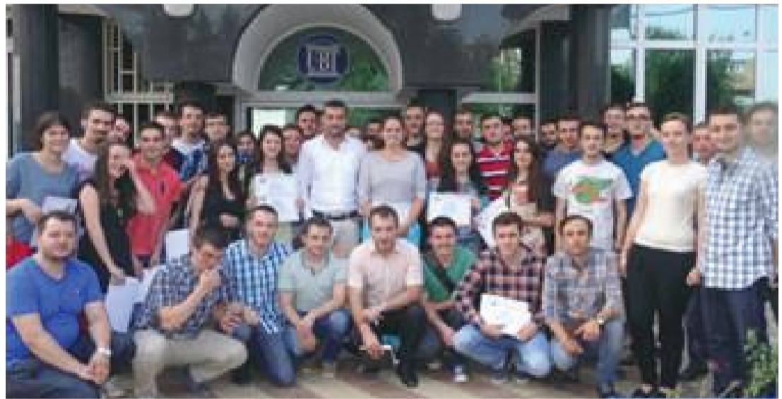
Akademia Verore Ndërkombëtare e UBT-së ka zhvilluar punimet për një muaj rresht. Në këtë edicion ishin pjesëmarrës një numër i madh studentësh, jo vetëm të nëntë fakulteteve të UBT-së, por edhe të universiteteve të jashtme ndërkombëtare si dhe të tjera vendore, dhe ligjëruan një varg i profesorëve tanë dhe të huaj dhe ekspertë të temave e caktuara

Akademia Verore Ndërkombëtare e UBT-së ka zhvilluar punimet për një muaj rresht. Në këtë edicion ishin pjesëmarrës një numër i madh studentësh, jo vetëm të nëntë fakulteteve të UBT-së, por edhe të universiteteve të jashtme ndërkombëtare si dhe të tjera vendore, dhe ligjëruan një varg i profesorëve tanë dhe të huaj dhe ekspertë të temave e caktuara.