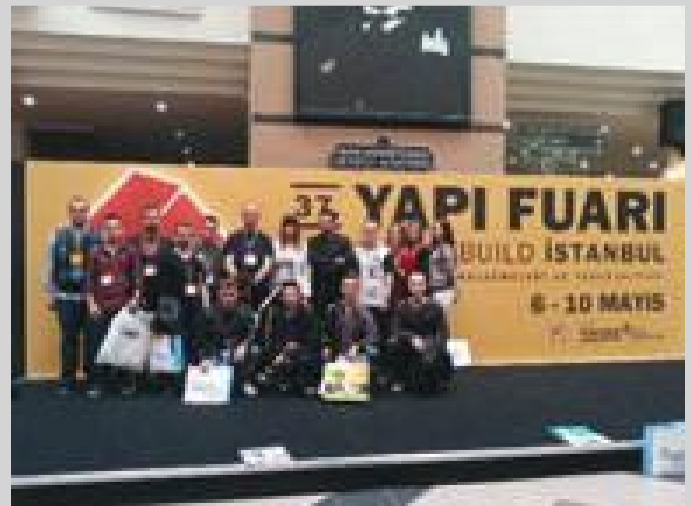
Studentët e Arkitekturës gjatë vizitës në Stamboll