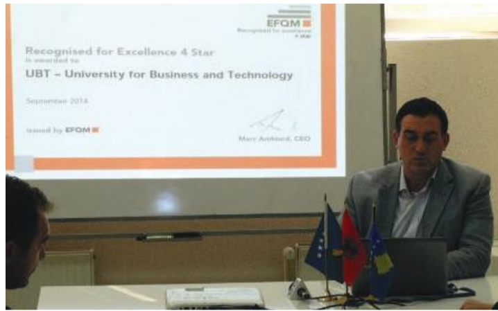
“UBT me të drejtë tani po konsiderohet si ambasador i dijes dhe shkencës në Republikën e Kosovë”

“UBT-ja nuk po mendon vetëm për veten, por ne po punojmë që përfitues i drejtpërdrejtë të jetë edhe Kosova. UBT-ja ka pasur rezultate, hulumtime, publikime, dhe ka një infrastrukturë moderne, laborator modern dhe të gjitha këto kanë ndikuar që të marrim vlerësime nga të gjitha fushat si për cilësi, menaxhim, leadership etj.