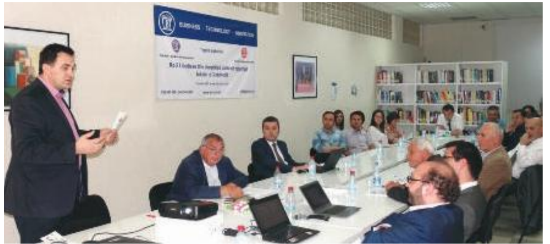
Nga folësit kjo qendër u cilësua e rëndësishme së veçantë dhe me një koncept të ri, si një urë bashkëpunimi ndërinstitucional, dhe për t'i ndihmuar vendit tonë që dhe rajonit e më gjerë

"UBT SIM" do të jetë simulimi i modeleve, vizualizimi, parashikimi dhe optimizimi i vendim-marrjes. Këto lloj kërkimesh do të çojnë në më shumë publikime. Krijimi i modeleve për shpjegimin e problemeve dhe fenomeneve që shohim sot në shoqëri, për shembull "health carë", nuk e dimë sa kushton, si zhvillohet procesi, çmimi i barnave, po ashtu çështja e burimeve, nuk e dimë si po menaxhohen sepse nuk kemi modele", ka thënë ai.