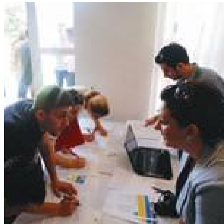
Interesim i madh për drejtimet e UBT-së

Pasi vetëm UBT njihet në vend dhe më gjerë për cilësinë dhe zhvillimin e Fakultetit të për Fakultetin e Shkencave Kompjuterike, dhe Fakultetin Menaxhment, Biznesit dhe Ekonomi, dhe në të nuk mungoi as pjesëmarrja e studentëve të këtyre drejtimeve studimore.