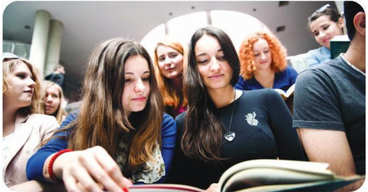
Përmes këtij projekti, i cili ka një buxhet prej 3.000.000 € dhe do të zgjasë nga viti 2014 deri në vitin 2018, do të ofrohen 156 bursa

Në kuadër të projektit "ERASMUS MUNDUS", përfshihen 20 universitete nga rajoni dhe Evropa, prej tyre 11 vendet e Ballkanit, dhe 9 nga Evropa. Ndryshe UBT është i vetmi institucion privat nga Republika e Kosovës që është