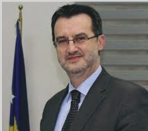
Rrugëtim i gjatë deri te Ligji i Sigurimeve Shëndetësore

Ai shpjegoi para studentëve se këto veprime për të ndryshuar qasjen dhe për të kaluar nga një sistem i vjetër në një sistem të riorganizuar dhe me sistem decentralizues ka qenë synim i kamotshëm i tij, ngase decentralizimi i shërbimeve dhe financimit shëndetësor, sipas Ministrit, është një reformë