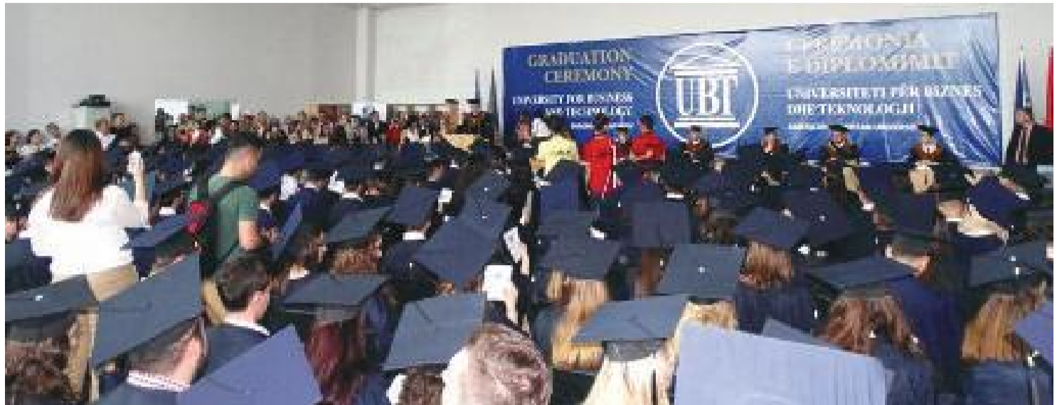
Të pranishëm në këtë ceremoni madhështore ishin prindër dhe familjarë, përfaqësues të institucioneve të Republikës së Kosovës dhe të atyre ndërkombëtare, përfaqësues të ambasadave të akredituara më zyre në Prishtinë, dekanët e fakulteteve, profesorë dhe studentë të UBT-së dhe të dhe të ftuar të tjerë

5 korrik 2014- Në një ceremoni madhështore, organizuar në Kampusin e ri universitar të UBT-së, u zhvillua Ceremonia e Diplomimit 2014, në të cilën studimet bachelor dhe master i përmbyllën mbi 350 studentë të Fakulteteve: nga dyja nivelet e studimit Fakulteti për Menaxhment, Biznes dhe Ekonomi, Fakulteti për Shkenca Kompjuterike dhe Inxhinieri, Fakulteti për Makronikë, kurse Fakulteti për Arkitekturë dhe Planifikim Hapë-