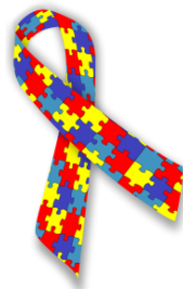
Figura 2:(Simbol) Karakterizon kompleksitet e Autizmit