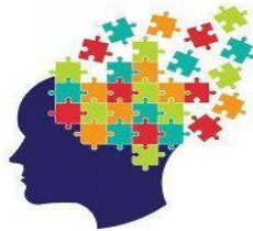
Figura 1: Simbol (Truri autik)

Njerëzit autik e shohin, dëgjojnë dhe ndiejnë botën ndryshe nga njerëzit e tjerë. Nëse jeni autik, jeni autik për jetë, autizmi nuk është sëmundje por as nuk mund të shërohet.