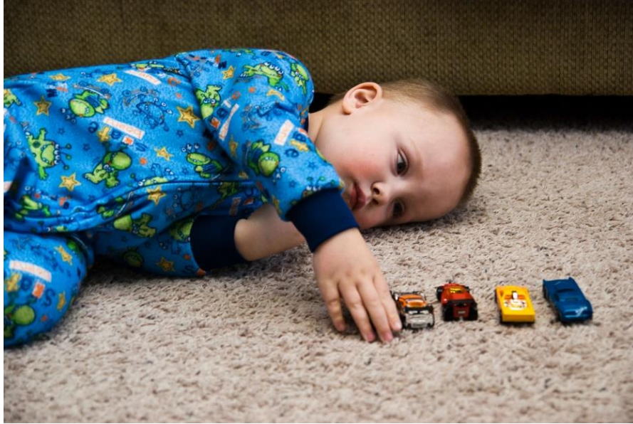
Figura 4:(Fëmija autik duke luajtur)