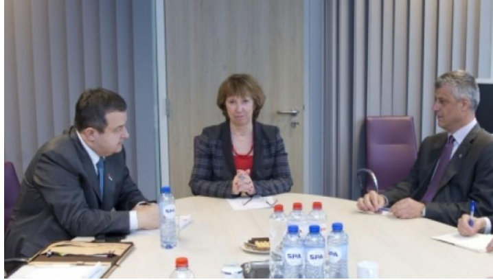
Figura 2. (Takim në mes Catherine Ashton dhe dy kryeministrave Hasim Thaçi dhe Ivica Dačić)