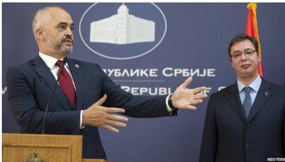
Figura 5. (Kryeministri i Shqipërisë Edi Rama dhe ai i Serbisë Aleksander Vucic në një konferencë)

Diplomatët kishin provuar të zgjidhnin marrëdhëniet pas përleshjeve të muajit të kaluar dhe radioja serbe B92 raportoi se zoti Rama kishte folur përpara udhëtimit të tij për një fillim të ri për Ballkanin". (Shiko këtu https://www.bbc.com/news/world-europe-29985048 )