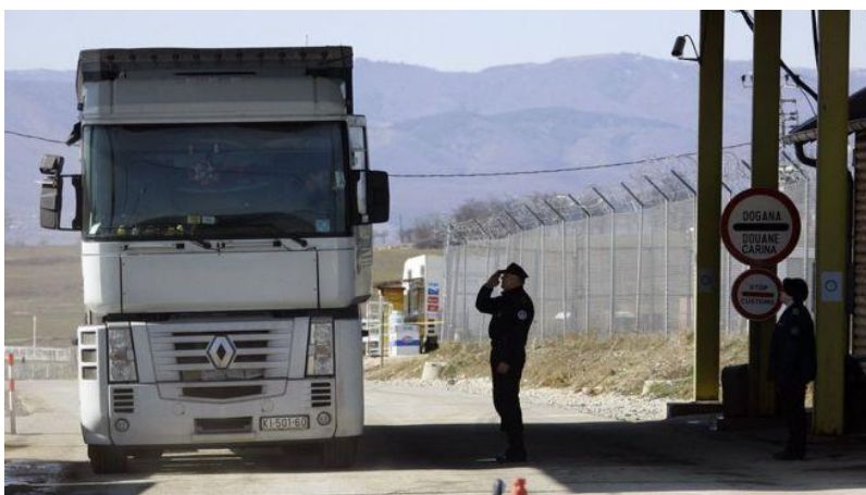
Figura 13. (Mallrat që kalojnë si fillim në doganë)

Më shumë se 110 vende e njohin republikën me shumicë shqiptare, por Rusia dhe disa shtete anëtare të BE-së përfshirë Spanjën dhe Greqinë, jo.