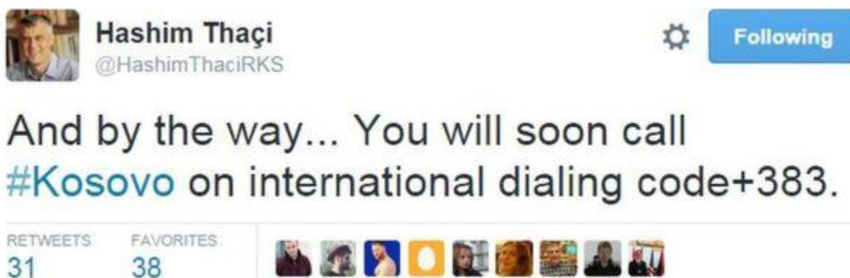
Figura 6.(Postimi i Ministrit të Jashtëm Hashim Thaci për lajmrin e kodit ndërkombëtar të Kosovës +383)

Marrëveshja gjithashtu do t'i japë fund bezdisë për përdoruesit e telefonave celularë të Kosovës për të përdorur kodet ndërkombëtare Monaco ose Slloveni. Zonat me shumicë serbe në veri do të jenë ende në gjendje të përdorin kodet e thirrjeve serbe."