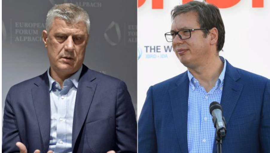
Figura 12. (Presidentët e të dyja vendeve)

Paraardhësi i zonjës Mogherini, Catherine Ashton, filloi bisedimet për normalizimin. Ajo i tha BBC së të dy presidentët po përpiqeshin të arrinin në një përfundim "por miratimi ndërkombëtar do të ishte çelësi i çdo marrëveshjeje.