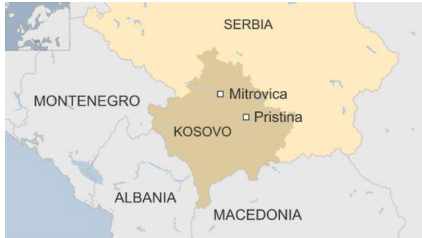
Figura10. (Harta e Kosovës)

Pra, marrëveshja mbetet e pazbatuar - dhe dyshimi i ndërsjellë midis shumicës shqiptare dhe pakicës serbe vazhdon. Kjo lejon që nacionalistët e të dy etnive të përdorin frikën për të manipuluar elektoratin.