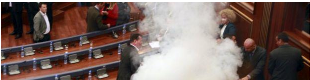
Figura 7. (Deputetet e opozitës së Kosovës duke hedhur gaz lotsjellës në parlament)

"Aksioni ynë në parlament dhe në sheshe po arrin mediat ndërkombëtare dhe vendimmarrësit ndërkombëtarë. Më parë, ata e panë Kosovën si jo shumë të rëndësishme kur ishte fjala për demokracinë ose mendimin e opozitës ose popullit. Tani ne kemi një petition të nënshkruar nga 200,000 qytetarë dhe shpresoj se mendimi ndërkombëtar do të ndryshojë "