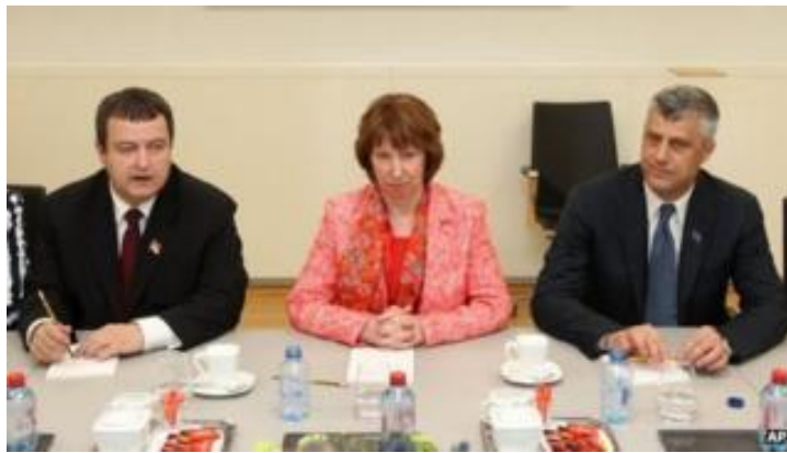
Figura 4. (Catherine Ashton së bashku me kryeministrat e të dy vendeve, Kosovës dhe Serbisë)

Pas disa takimeve në Bruksel në mes të dy vendeve, arrihet një marrveshje mes dy paleve me ndihmën e Bashkimit Evropian.