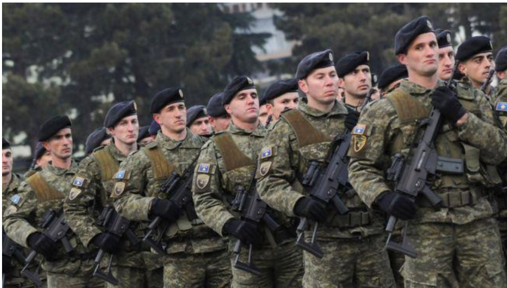
Figura 14. (Ushtarët e ushtrisë së Kosovës në detyrë)

Serbia e shikon një forcë ushtarake të kontrolluar nga Prishtina si një kërcënim për pakicën etnike serbe me 120,000 banorë të Kosovës.