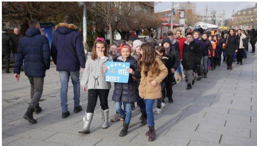
Figura 9. (Fëmijët duke festuar festën e pavarësisë së Kosovës në sheshin e Prishtinës)

Shkalla e papunësisë së të rinjve në Kosovë është rreth 60%. Vetëm të rinjtë e Bosnjës vuajnë më shumë. Por Kosova ka popullsinë më të re në Evropë ku rreth gjysma e njerëzve të saj janë nën moshën 25 vjeç.