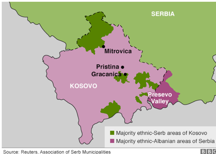
Figurra 11. (Harta e Kosoves ku tregonë popullsinë e serbëve në Kosovë)

Një moment historik apo një propozim që do të thoshte luftë? Spekulumet janë të shumta se të dy palët mund ta bëjnë konceptin zyrtar kur presidentët e tyre takohen për bisedime të planifikuara në Bruksel. Ideja duket e thjeshtë. Lugina e Preshevës në jug të Serbisë, ku popullsia është kryesisht etnike shqiptare, do t'i bashkohej Kosovës. Në kthim, Serbia do të rivendoste kontroll të plotë mbi zonën me shumicë etnike-serbe të Kosovës në veri të lumit Ibar, i cili përshkon zemrën e Mitrovicës.