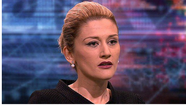
Figura 3. (Mimoza Kusari Lila në intervistë Hardtalk në BBC)