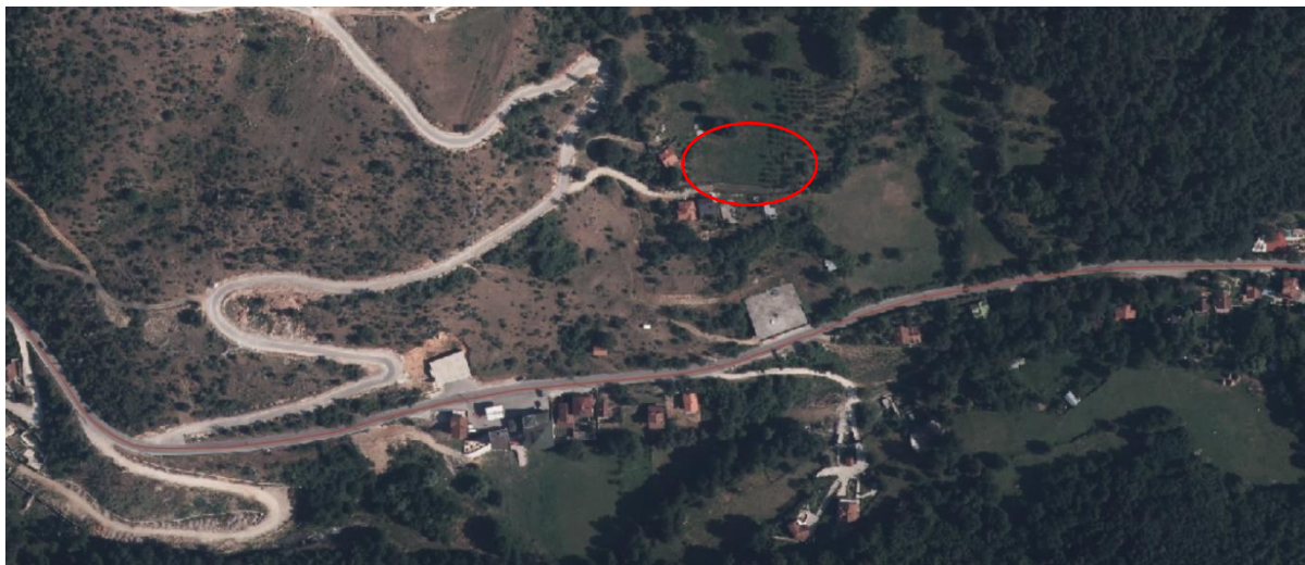
Figura 3. Parcela e lokacionit

Në lindje të Komunës së Prizrenit përkatësisht në fshatin Reçanë në parcelen me numër kadastral 02615-0 me sipërfaqe prej 2538m 2 , me qasje të parcelës në rrugë nga ana veriore të bëhet projektimi i Viles luksoze për 7 anëtarë (2 gjyshërit, 2 të rritur dhe 3 fëmijë) me 2 etazhe (P+K) duke përdorur standardet e projektimit dhe duke respektuar planet zhvillimore urbanistike (nëse ka).