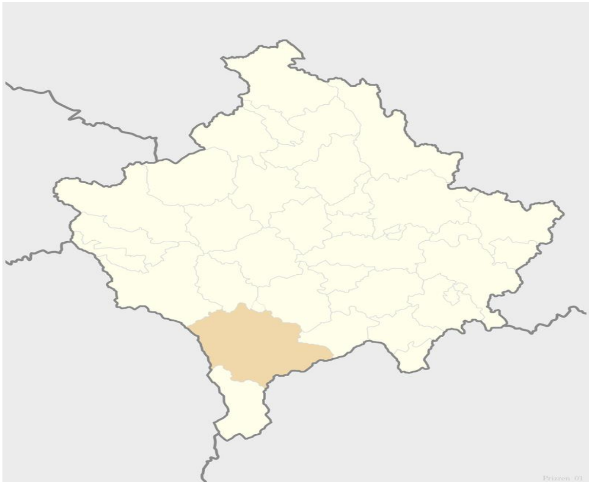
Figura 1. Pozita e Prizrenit në kuadër të Kosovës

Prizreni qytet në pjesën jug-perëndimore të Kosovës si dhe i dyti në Kosovë për nga madhësia dhe popullsia pas Prishtinës .