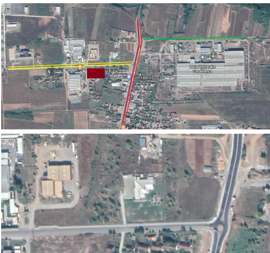
Fig.3. Lokacioni Shirokë (Suhareke).

Në kontekstin e shfrytëzimit të tokës, nga të dhënat e komunës së Suharekës është bërë analiza hapësinore e tokës bujqësore ku janë shqyrtuar humbjet e tokave bujqësore, shkaktarët e humbjes së përkohshme dhe të përhershme të tokës bujqësore. Analiza në vete ngërthen edhe problematiken e humbjes së tokave bujqësore që nga vitet e mëhershme e deri më sot, duke bërë analizat e hartave topografike të mëhershme dhe atyre të mëvonshme. Në mungesë të hartave të gjendjes ekzistuese të tokave bujqësore, çështja e humbjes së tokave bujqësore mbetet si çështje që kërkon hulumtime.