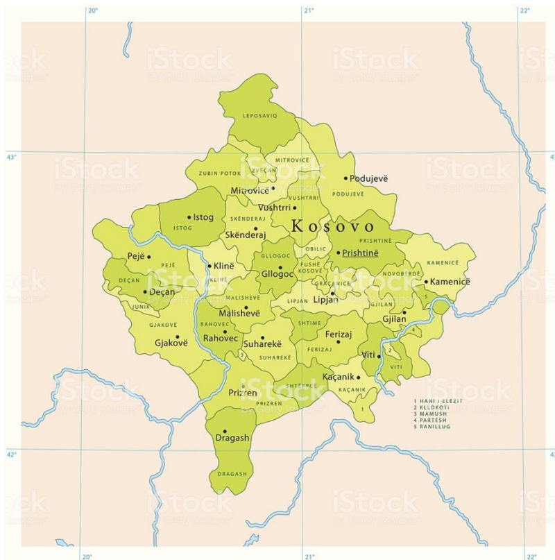
Fig. 5.. Ndarja e komunave ne bazë te demografisë ne Kosovë.