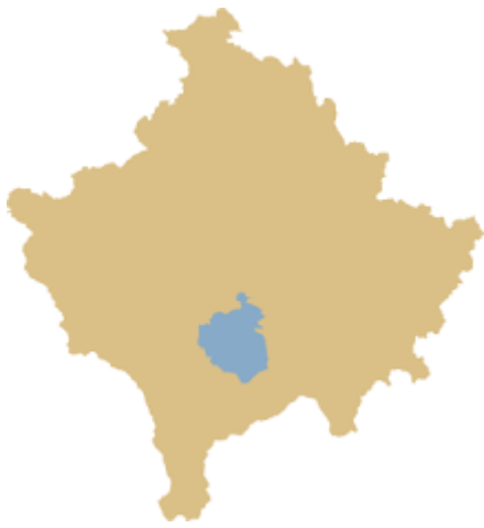
Fig. 1. Harta e Kosoves( Vendi Suhareke)

sundimit të Serbisë dhe të Jugosllavisë Socialiste. Pas luftës filloi një rindërtim dhe zhvillim i ngadalshëm. Qyteti i Suharekës dhe fshatrat e saj fituan një fizionomi të re të zhvillimit dhe të ndërtimit. Ishte një fazë e transformimit në aspektin ekonomik, politik, shoqëror etj. Kriza tjetër fillon të shfaqet pas vitit 1981 kur Serbia fillon aktivizimin e planeve hegjemoniste të njohura më parë, ndërsa me 1989 e suprimoi autonominë e Kosovës. Periudha e okupimit zgjatë deri në vitin 1999 ku edhe përfundon me luftë.