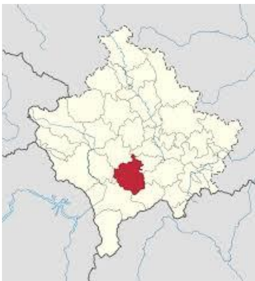
Fig. 4. Ekonomia e Suharekes.

Prej objekteve tjera industriale të pashfrytëzuara mund të përmendim objektet e Fabrikes “DAMPER”, e cila ka qënë si objekt në kuader të IGK”BALLKAN” për prodhimin e gomave për mjete të rënda transportuese. Ka një hapsirë (siperfaqe) të mbuluar prej rreth 6 ha, në të cilën parashiheshin të punësoheshin rreth 3000(tre mijë) punëtorë. Pas lufte aty u vendosën forcat e KFOR-it (Kampi CASA-BLANCA) dhe ky objekt nuk punon që prej katër vitesh. Gjithashtu nuk funksionojn objektet e ish fabrikës për prodhimin e dyerve dhe dritareve të metalit “SECO”, objektet e KOOPERIMIT në Mushtisht, Studenqan, Nishor e Duhël; objektet e fermes bujqësore në Sallagrazhde, ndërsa fabrika për prodhimin e elementeve të betonit në Reshtan momentalisht shfrytëzohet si depo nga firma “Hidroterm”. Burimi: “Komunat e Kosovës”, AKK, Prishtinë, dhjetor 2005 Burimi: Profili Komunal—Suharekë, OSBE, maj, 2006.