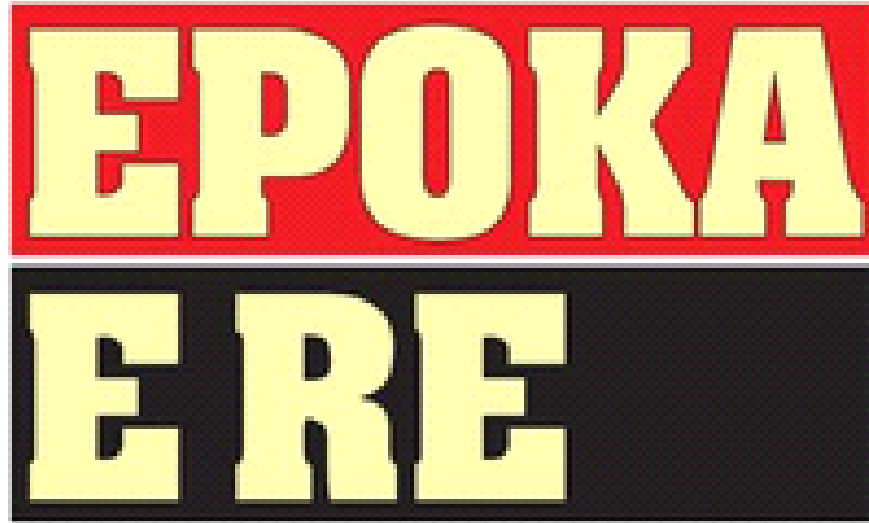
Fig.3. Logoja e gazetës Epoka e re

U themelua me 15 dhjetor 1999, numri i parë doli me 25 janar 2000.