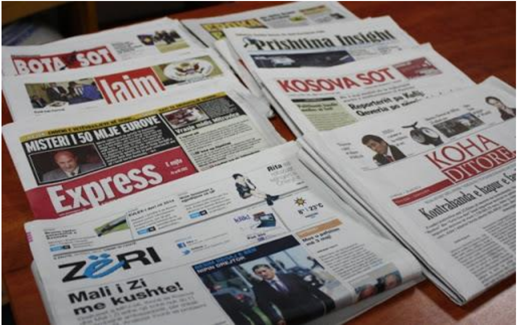
Fig.5 Gazetat Sot